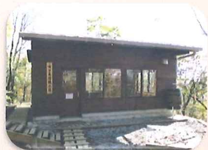
畦ヶ丸避難小屋が立て替えられました。 室内は明るくてトイレも綺麗です。