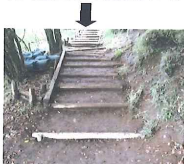
補修後： 丸太二段の上段 6 本を撤去し、手前に一段増設して段差を解消。右端に斜め丸太を入れて脇歩行を防止しました。