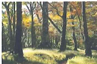
盛秋のブナ林・天王寺尾根上部

天王寺尾根と上部の堂平は言うまでもありませんが、大室山、臼が岳南稜、 弁当沢の頭付近、駿相境の三国山などが挙げられます。檜洞丸や同角山稜な どは過去には鬱蒼たるブナ林が覆っていましたが、今やスカスカの明るい山 頂部になっています。ブナの衰勢ははっきり表れています。温暖化や酸性雨 やブナハバチの影響とか原因はいろいろ言われていますが、誠に残念なこと です。ブナ林の美しさをなんとか後世に伝えていきたいものです。