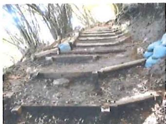
No.15下部 補修後の 丸太階段工

No.15下部の角材階段3段の上部一段の取り外しと、二段丸太階段9段の上部一段の取り外しを実施。加えて、No.15上の二段丸太階段9段の上部一段取り外し等も行いました。