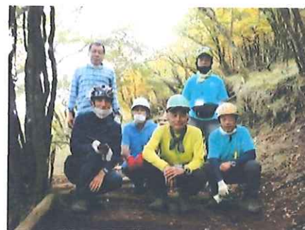
無事に作業終了！ 全員で楽しめた体験でした