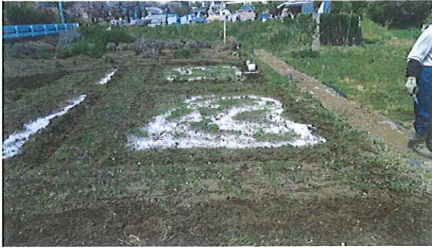
ハーブエリアを拡大