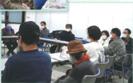
発言者の話に関心する参加者のみなさん▶