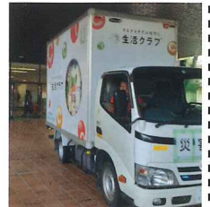
生活クラブ生協等の生協も支援に入っています。

1月元旦に発生した 能登半島 大地震の支援活動。「最も小さくされた人に偏った支援を行う」が活動方針です。支援物資の調達、被災した地域での「復興支援」や「生活再建支援」に取り組むNPO法人等への支援を行っています。