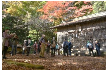
追分社の紅葉 落ち葉の絨毯