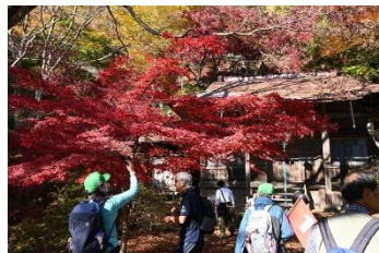
前不動前の紅葉は銀杏とのコラボ

Aコース(全行程徒歩)、Bコース(大山寺まで徒歩+ケーブルカー利用)、Cコース(全行程ケーブルカー利用) A・Bコースがあわせて13名、Cコースが13名と、思わず笑ってしまうほどの絶妙なバランスでした。大山行きのバス停は紅葉シーズンで大混雑でしたが、運よく臨時直通バスが増便。しかも落語家さんによる大山案内付きという粋な演出まで! 終点で降車後は青木館さんの駐車場をお借りして準備体操し、いよいよウォーク開始です。こま参道の階段を進んでケーブル駅へ。ここで徒歩組とケーブル組に分かれます。徒歩組は女坂を歩き、大山女坂の七不思議を説明しながら進む秋らしいコース。見頃の紅葉と落ち葉の絨毯が心地よく、休憩を挟みつつ順調に登りました。大山寺ではケーブルカー組と合流。お客様で賑わう境内では、28日限定の大師堂御開帳に立ち会うことができ、大山厄除け饅頭もゲット! その後、再び徒歩組6名とケーブル組7名に分かれ、阿夫利神社下社を目指します。女坂は後半から勾配が増しますが、皆さん踏ん張って無事到着しました。下社では班ごとに記念撮影を行い、御神水や納め太刀、さざれ石を見学。浅間神社にも参拝し、秋の大山を満喫しました。来年も皆さんと美しい紅葉を楽しめることを心より願っています。