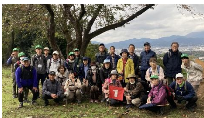
疲れを感じさせない健脚自慢の皆様、峠の展望を背景に記念撮影