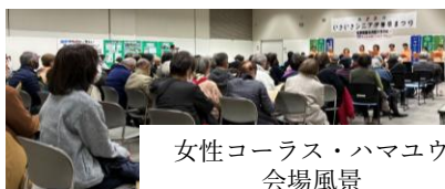
女性コーラス・ハマユウ 会場風景