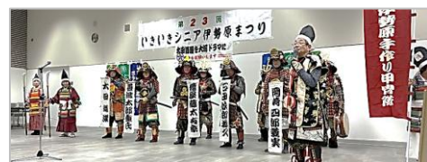
神奈川観光大使 伊勢原手作り甲冑隊5人の武将