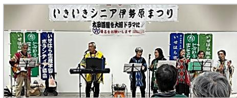
バンドジヤンボチエカ