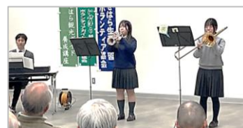
自修館中等教育学校高校生