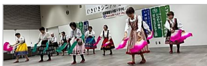
シニアスマイルのレクダンス