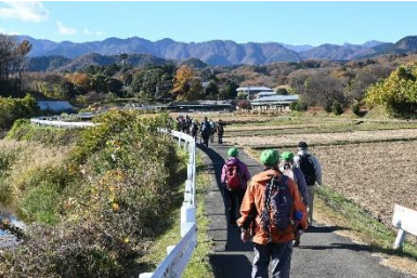
初冬の凜とした空気が心地よい