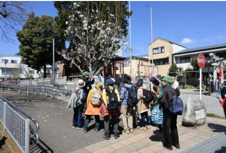
国栄(くにさかえ) 稲荷神社、コブシの花が美しい