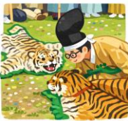
イラストの座問答

その後、五社は揃ったことを六所神社(総社)へ報告し、これを受けて総社が行列を整えて出発します。五社の御輿も逢親場(馬場公園)へ向かい、入場に