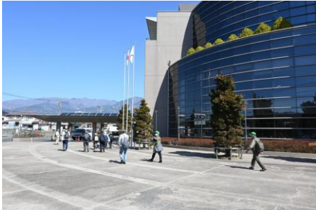
秦野保健福祉センターから望む丹沢の山並み