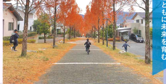
2025年度 住まいのまちなみ賞 みどり坂町内会(広島県広島市安芸区)