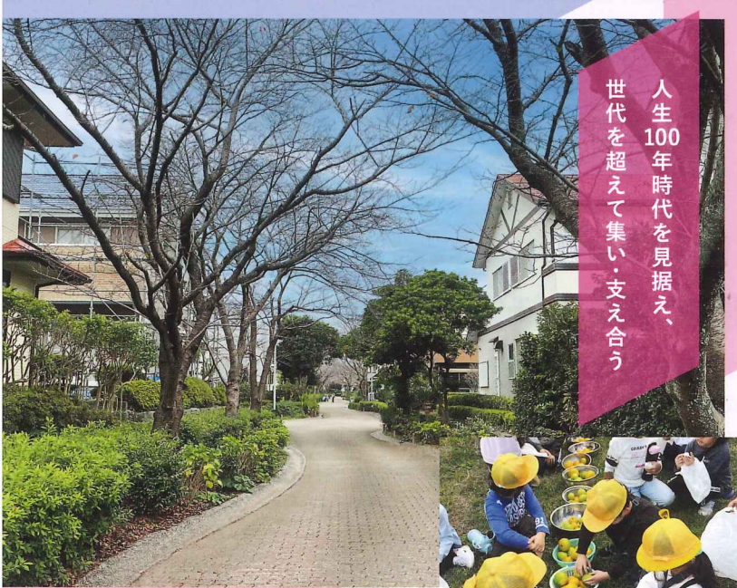
2025年度 国土交通大臣賞 特定非営利活動法人きやまSGK(佐賀県三養基郡基山町)