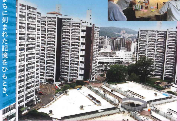
2025年度 住まいのまちなみ賞 6コア自治会(広島県広島市中区)