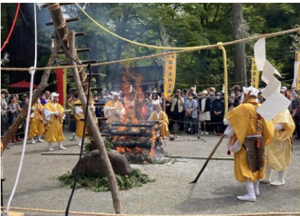
護摩壇着火、この後、無病息災を願ひ火渡りが行われます