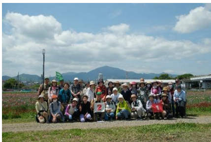
大山と大田のお花畑を背景に記念撮影