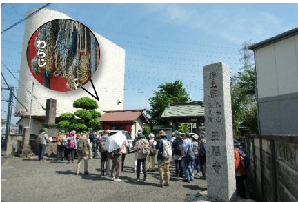
三福寺の正面左には「子の権現」わらじが奉納されています