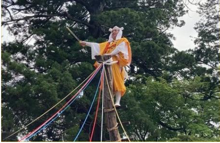
神木のぼりの儀式(刀で九字切りで邪気を払う)

かつては日向修験の中心地、峰々に山伏の吹く法螺貝が響いていたことでしょう。修験道廃止令により神木のぼりは途絶えましたが1974年に復活、その後「宝城坊神木のぼり保存会」の方々が継承されています。山伏が読みあげた祈願文の如く皆「安穏平安」に過ごせますように。