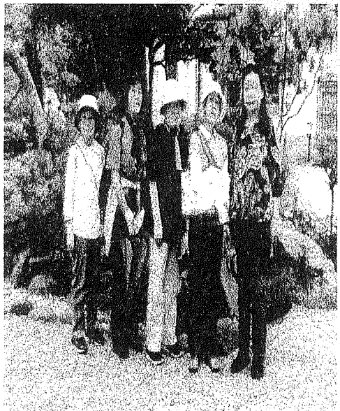
満足、満足…また、来たいね

5月19日「今度こそ白秋童謡館」イベントを実施しました。参加者は6人と少なめでしたが、お堀のそばを歩き、三の丸小学校の外観に感心しながら、20分位で小田原文学館の敷地内にある「白秋童謡館」へ。この文学館は、国の登録有形文化財となっていて、旧田中光顕氏の別邸だそうです。入館料は250円。モニターを操作して、耳に優しい童謡の数々、「あわて床や」「この道」「からたちの花」等々を楽しみました。白秋の故郷、九州柳川の風景や、白秋が愛した小田原の風景を背景に、地元の少女合唱団やママさんコーラスの柔らかく澄んだ歌声に包まれてい