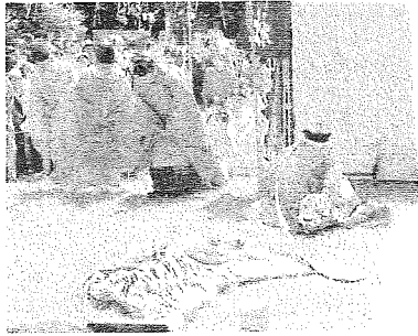
1,000年以上続く神事「座問答」

の祭りの説明を班毎に行い、出店の準備も始まっている逢親場(おおおやば)とよばれる神対面の場所となる馬場公園で休憩した後、相模五社が集い祭事を行う神揃山(かみそろいやま)に向かいました。五社の神揃山祭場からの出口と三宮神社の入口を過ぎ、三之宮神社の入口の急坂を上り、化粧塚を過ぎ、祭場に到着したところで祭場の説明を行い、五社の入場を待ちました。一之宮寒川神社、二之宮川勾神社に続いて