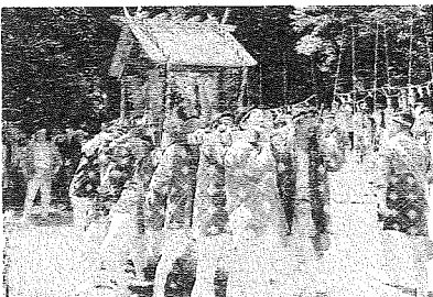
比々多神社暴れ御輿