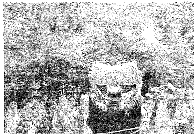
比々多神社によるちまき撒き