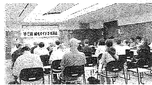
第15回観光ガイド養成講座

伊勢原は関東の霊峰大山があり、人の存在歴史2万8千年を誇り、多くの史跡があります。この特徴を生かして、観光振興と街興しをボランティアで約30年活動してクリーンの帽子が映える観ボラが実施するガイド講座のスタートです。