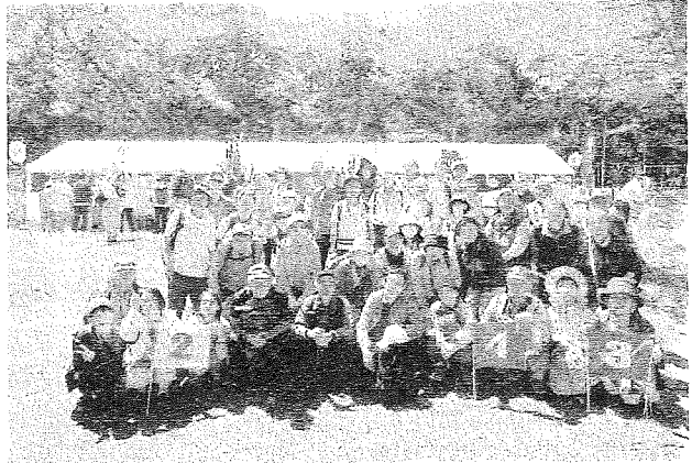
神揃山(かみそろいやま)で集合写真

文字通りの五月晴れに恵まれ、相模随一といわれる国府祭(こうのまち)見学ウォークを行いました。大磯という比較的遠隔地で8時45分という早い集合時間でしたが、多くのご参加を頂きました。大磯駅発の8時55分発のバスに乗り大磯プリンスホテル入口で下車し、祭場へ向かいました。